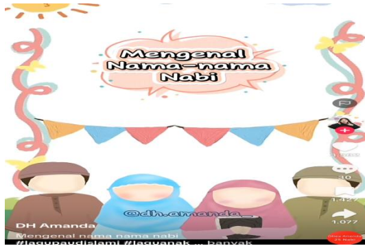
Gambar 6. Lagu Nama-Nama Nabi

Tanggal Upload video 4 Desember 2023 Video ini memperkenalkan nama-nama 25 Nabi dalam Islam secara berurutan melalui lagu yang ceria dan ritmis, disertai visual menarik yang penuh warna. Pendekatan ini secara efektif memadukan aspek kognitif dan afektif dalam pembelajaran akidah bagi anak usia dini. Dengan menggunakan lagu sebagai sarana penyampaian, video ini tidak hanya membantu anak menghafal nama-nama Nabi, tetapi juga membentuk hubungan emosional yang positif terhadap tokoh-tokoh keagamaan. Dalam konteks pendidikan keimanan, mengenalkan nabi sebagai panutan sejak dini merupakan langkah penting dalam membangun fondasi spiritual anak. Melalui representasi simbolik dan naratif yang mudah dipahami, anak mulai memahami nilai-nilai luhur seperti kesabaran Nabi Nuh, keberanian Nabi Ibrahim, dan kelembutan Nabi Isa.