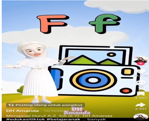
Gambar 1. Video Pengenalan Huruf A-Z

Video ini tertampilkan tanggal 15 November 2023. Video ini menyajikan animasi yang penuh warna, bergerak dinamis, dan dilengkapi dengan lagu anak-anak yang interaktif sebagai sarana pembelajaran alfabet dari A hingga Z. Setiap huruf ditampilkan dalam bentuk visual yang besar, kontras, dan mudah dibaca oleh anak-anak, serta disertai contoh kata sederhana yang diawali dengan huruf tersebut, seperti "A untuk Apel", "B untuk Bola", dan seterusnya. Lagu yang digunakan bersifat repetitif dengan irama yang menyenangkan, memungkinkan anak untuk mengingat huruf dan asosiasinya secara bertahap.