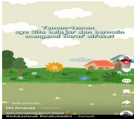
Gambar 4. Lagu Abjad Sederhana

Tanggal Upload 13 Juni 2024, Video ini menyajikan lagu abjad dari A hingga Z yang dinyanyikan dengan nada ceria dan ritme yang mudah diikuti oleh anak-anak, meskipun tanpa disertai contoh kata maupun visualisasi tambahan. Meskipun tampak sederhana, konten ini memiliki nilai edukatif yang kuat, khususnya dalam melatih pengulangan (repetisi) dan memperkuat daya ingat anak terhadap urutan huruf alfabet. Lagu abjad telah lama dikenal sebagai metode klasik yang efektif dalam mengenalkan struktur alfabet kepada anak usia dini, terutama melalui pendekatan auditori yang menstimulasi memori fonologis. Dalam konteks pembelajaran, video ini berperan sebagai reinforcement atau penguatan terhadap materi yang sebelumnya telah dikenalkan secara visual, seperti dalam video pengenalan huruf bergambar. Repetisi melalui lagu membantu anak menginternalisasi bentuk dan urutan huruf, memperkuat memori jangka panjang, dan memfasilitasi transisi menuju keterampilan literasi awal. Konten semacam ini sangat berguna sebagai bagian dari rutinitas belajar anak, baik di lingkungan sekolah maupun di rumah, karena mampu menciptakan suasana belajar yang menyenangkan dan tidak membebani.