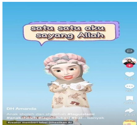
Gambar 5. Lagu Anak Sholeh

Video ini menyampaikan nilai-nilai moral dan ajaran agama Islam seperti kejujuran, gotong royong, salat, dan penghormatan kepada orang tua melalui lagu anak-anak yang sederhana, mudah diingat, serta dilengkapi ilustrasi visual yang menarik. Penyampaian yang menyenangkan ini memudahkan anak memahami pesan-pesan moral secara natural. Dalam pendidikan anak usia dini, aspek moral dan spiritual merupakan fondasi penting pembentukan karakter. Berdasarkan teori experiential learning , anak belajar terutama melalui pengalaman langsung, peniruan, dan pengulangan terhadap apa yang mereka lihat dan dengar.