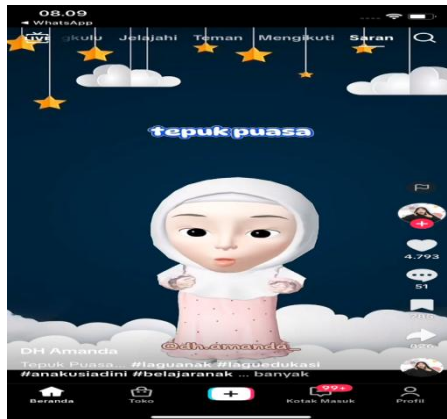
Gambar 7. Lagu tentang Puasa Ramadhan

Video ini mengangkat tema puasa Ramadhan melalui lagu anak-anak yang ringan, edukatif, dan mudah diikuti. Disampaikan dengan ilustrasi kegiatan seperti sahur, menahan lapar, bersabar, hingga berbuka, video ini menggambarkan ibadah puasa dengan cara yang menyenangkan dan sesuai dengan dunia anak. Mengingat anak usia dini belum memahami konsep spiritual secara abstrak, pendekatan musikal dan visual seperti ini sangat efektif untuk memperkenalkan nilai-nilai ibadah secara konkret. Lagu tersebut tidak hanya memberikan informasi tentang puasa, tetapi juga menanamkan nilai penting seperti disiplin, pengendalian diri, kesabaran, dan rasa syukur. Dengan demikian, video ini berperan dalam membentuk pemahaman awal anak tentang makna Ramadhan secara emosional dan kontekstual. Tanggal Upload 20 Maret 2024