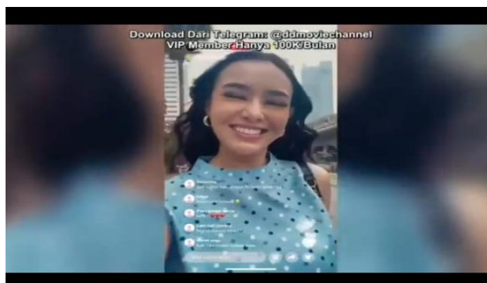
Gambar 3. Film Pay Later