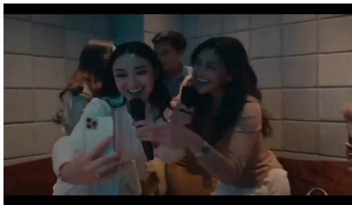
Gambar 7. Film Pay Later

Pada level realitas adegan memperlihatkan Tika dan teman kantornya berada di ruang karaoke, sambil bernyanyi bersama dengan melakukan life streaming melalui media sosial. Adegan memperlihatkan Tika membagikan moment kebersamaan itu dengan handphone . Karakter Tika sebagai influencer dalam adegan tersebut berusaha ingin mendapatkan like , komentar, dan endorsement dari pengikut terkait pengalaman pribadinya sendiri. (Erving Goffman, 1959). Adapun teknik kamera yang digunakan dalam adegan ini ialah teknik medium shut. Dengan pencahayaan yang sedikit redup tapi menciptakan kesan keakraban dan kehangatan bersama teman-teman (Joseph v. Mascelli, 1965). Ideologi yang relevan dengan