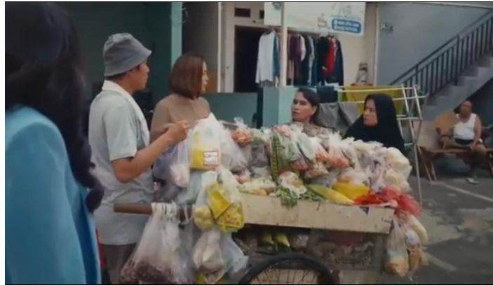
Gambar 8. Film Pay Later

Pada level realitas, terlihat scene berlatar belakang di kompleks pinggir ibu kota dengan suasana yang padat dengan penduduk dan aktifitas kehidupan sehari-hari masyarakat saat berbelanja di gerobak sayur keliling. Dalam adegan terlihat ada beberapa tokoh pemeran lain yang mendukung suasana lingkungan penduduk di gang itu seperti bapak- bapak, ibu- ibu, dan tukang sayur keliling. Level representasi, adegan menunjukkan keadaan lingkungan dan suasana yang sederhana seperti di atas memperlihatkan representasi ekonomi kelas sosial menengah ke bawah. Dialog ibu- ibu yang memuji penampilan Tika menunjukkan perempuan cantik selalu dikaitkan dengan status ekonomi dan kesuksesan. Sehingga perempuan sering mengikuti standar kecantikan dan ingin mendapatkan pengakuan di depan publik, meski harus berhutang sekalipun. Tekanan ini mendorong perempuan untuk selalu berpenampilan menarik agar dapat menciptakan personal branding yang sesuai. (Emile Durkheim, 1895). Teknik kamera menggunakan medium shut yang diambil dari bagian pinggang hingga ke bagian atas kepala yang bertujuan untuk memperlihatkan beberapa tokoh dalam adegan dan latar belakang lingkungan sekitar. Ideologi yang relevan dengan adegan diatas ialah adanya ideologi materialisme. Ideologi ini lebih memperlihatkan ibu- ibu kompleks sebagai masyarakat dalam film memandang kepemilikan barang dan penampilan menjadi tolak ukur kesuksesan seseorang (Christopher Lasch, 1979).