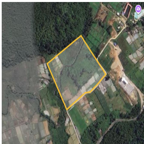
Gambar 1. Rencana Tapak