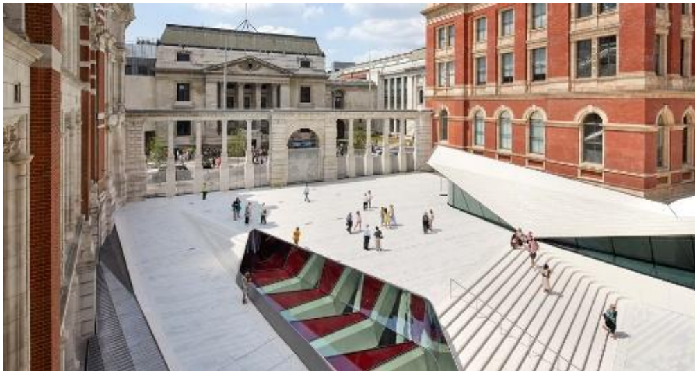
Gambar 2. Victoria & Albert Museum Exhibition Road Quarter

Victoria & Albert Museum Exhibition Road Quarter merupakan ekspansi utama museum V&A bersejarah di South Kensington, London, yang memperkenalkan halaman publik baru, aula masuk mencolok, dan galeri bawah tanah luas yang terintegrasi dengan struktur Victorian museum melalui pendekatan juxtaposition kontras (Levete, 2017; Martin, 2024). Proyek rancangan Amanda Levete Architects (AL_A) mengubah halaman servis yang kurang terpakai menjadi gerbang budaya dengan elemen modern seperti Sackler Courtyard berlapis porselen dan Sainsbury Gallery bebas kolom, yang sengaja dibuat berbeda dengan fasad bata merah ornamen Victorian untuk menonjolkan dialog tradisi-inovasi (Levete, 2017; Royal Academy, 2024). Alih-alih meniru estetika abad ke-19, geometri tajam dan finishing porselen justru mempertegas detail historis museum, menciptakan koeksistensi dua bahasa arsitektur dalam satu institusi budaya (Archello, 2023; Dezeen, 2024).