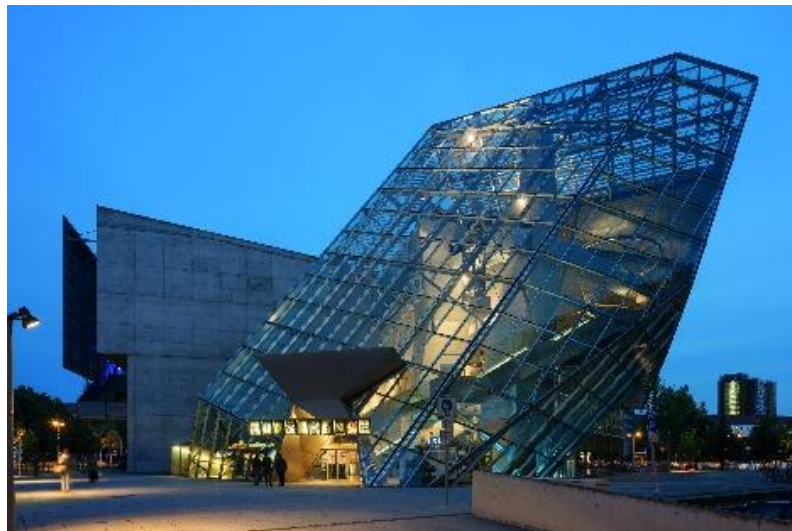
Gambar 1. Yerba Buena Center for the Arts

UFA Cinema Center di Dresden merupakan contoh arsitektur juxtaposition yang mencolok, di mana bangunan menggabungkan cangkang historis bioskop lama yang dilestarikan dengan struktur kaca dan baja kristal modern yang menonjol secara dramatis, menciptakan gerakan dan energi dinamis (Prix, 1998; Coop Himmelb(l)au, 2023). Desain Coop Himmelb(l)au ini mempertahankan dinding bata tua sebagai jangkar warisan pasca-Perang Dunia II, sementara kubus kaca futuristik bertindak sebagai kontras tajam yang menegaskan perbedaan era melalui geometri pecah versus stabilitas masonry (Swiczinsky, 2021; Archello Architecture Review, 2023). Pendekatan dekonstruktivis ini sengaja menonjolkan ketegangan visual antara masa lalu dan masa depan, menjadikan kontras sebagai dialog identitas kota Dresden yang bangkit dari kehancuran (Urbipedia Architecture Archive, 2022; Architizer Journal, 2024).