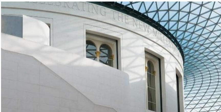
Gambar 4. Penerapan Juxtaposition antara Bangunan dan Kubah pada Bangunan British Museum

Atrium sentral berfungsi sebagai pusat sirkulasi vertikal dengan perpustakaan pusat terbuka publik mengelilingi Reading Room klasik, dikelilingi enam lantai galeri pameran, toko buku, kafe, dan restoran yang aksesibel dari South Portico klasik melalui tangga melengkung kontras dengan kubah modern (Foster Technical Documentation, 2021; British Museum Blog, 2020). Kubah berdiameter 47 meter dengan grid baja radial memungkinkan cahaya alami menembus courtyard dalam sepenuhnya, menciptakan efek "ruang dalam ruang" di mana struktur Victorian solid dikelilingi transparansi kaca mutakhir (Arquitectura Viva, 2022; YouTube Architectural Analysis, 2024). Zona transisi eksplisit berupa tangga South Entrance melengkung menghubungkan courtyard dengan galeri utama, menegaskan ketegangan arsitektural antara permanensi institusional dan keterbukaan informasi abad 21 (Foster + Partners Project Files, 2022; RIBA Journal, 2023).