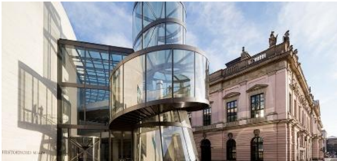
Gambar 3. Pei Extension Deutsches Historisches Museum

Pei Extension Deutsches Historisches Museum merupakan tambahan modern pada Zeughaus barok abad ke-17, yang dirancang I.M. Pei untuk memperluas fasilitas pameran dan pengunjung museum dengan fasad kaca transparan, atrium