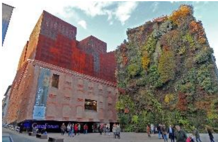
Gambar 5. CaixaForum Madrid

CaixaForum Madrid merupakan pusat budaya hasil redesign Herzog & de Meuron yang melestarikan fasad bata merah historis dari pembangkit listrik batubara Central Eléctrica del Mediodía (1900–1901) sambil menambahkan volume modern baja corten dan besi cor dengan efek mengambang di atas plaza publik (Herzog & de Meuron, 2008; AV Monographs, 2021). Diakuisisi La Caixa Foundation tahun 2001, proyek adaptasi warisan industri ini memperkuat struktur bata asli, menghilangkan plinth dasar, dan menambah volume baru sehingga dibuka publik 2008 sebagai landmark budaya dengan kontras eksplisit bata industri versus baja modern (El Croquis, 2009; Arquitectura Viva, 2022).