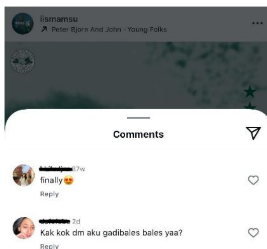
Gambar 4. Komentar di akun Instagram @iismamsu