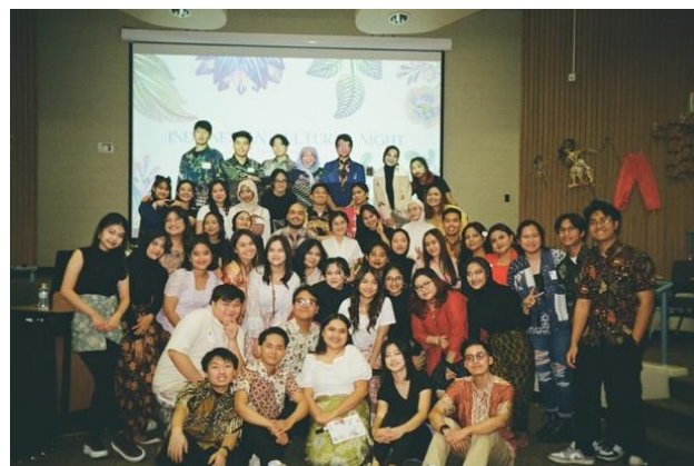
Gambar 3. Awardees IISMA MSU 2023

Dalam implementasinya, program IISMA tidak hanya mengandalkan saluran komunikasi resmi, tetapi juga memanfaatkan media sosial sebagai alat utama untuk menyebarkan informasi. Salah satu akun Instagram yang dikelola langsung oleh mahasiswa penerima IISMA adalah @iismamsu, yang berasal dari mahasiswa di Michigan State University, Amerika Serikat. Akun ini aktif membagikan berbagai konten seputar kehidupan kampus, tips beasiswa, dan pengalaman belajar di luar negeri, serta menggunakan format visual seperti foto, Reels , dan infografis. Per 15 April 2025, akun ini telah memiliki 3.242 pengikut dan 127 unggahan (IISMA Michigan State University, 2020).