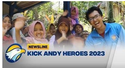
Gambar 4. Program Kick Andy Heroes 2023

Salah satu keunggulan Kick Andy yang membedakannya dari talkshow lainnya adalah segmen Kick Andy Heroes. Program ini secara khusus mengangkat sosok-sosok inspiratif yang telah memberikan kontribusi positif bagi masyarakat Indonesia. Melalui segmen ini, Kick Andy tidak hanya menyajikan hiburan, tetapi juga memberikan nilai sosial yang mendalam dengan membahas isu-isu kemanusiaan dan cerita-cerita inspiratif yang menyentuh hati penonton.