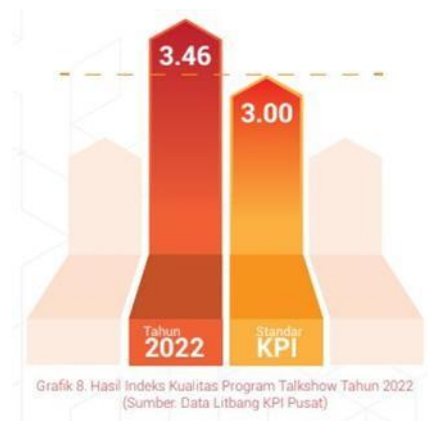
Gambar 2. Hasil Indeks Kualitas Program Talkshow tahun 2022

Berdasarkan hasil survei Komisi Penyiaran Indonesia (KPI) tahun 2022, salah satu program yang sedang diminati pemirsa adalah program tayangan talkshow . Survei terakhir menunjukkan bahwa program dalam kategori talkshow mencapai indeks sebesar 3,46, menunjukkan bahwa kategori ini telah memenuhi standar kualitas program yang ditetapkan oleh KPI (Komisi Penyiaran Indonesia, 2022). Diakses pada Sabtu, 19 Oktober 2014 pukul 13.47 WIB.