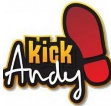
Gambar 1. Program Kick Andy

Arnaud Fraed, Presiden Commercial For Asia menjelaskan bagaimana Nielsen mengukur jumlah penonton TV di Indonesia melalui Nielsen Panel, yang mencakup lebih dari 12.000 rumah tangga di seluruh Indonesia. Panel ini dilengkapi dengan perangkat bernama Peoplemeter yang terhubung ke televisi di rumah-rumah (Marketeers, 2023). Diakses pada Jumat, 18 Oktober 2023 pukul 16.54 WIB Oktober 2023 pukul 18.30 WIB Meskipun data survei snapchart menunjukkan adanya perubahan signifikan dalam pola konsumsi media masyarakat, televisi tetap menjadi salah satu media yang bisa mencapai audiens dalam jumlah besar dan cepat dengan menyajikan beragam program menarik, seperti talkshow . Acara ini menampilkan diskusi antara narasumber mengenai topik tertentu dengan arahan dari seorang pembawa acara (Mariskhana, 2017). Salah satu program talkshow yang paling sukses di Indonesia adalah "Kick Andy," yang dipandu dengan baik oleh Andy F. Noya, program ini dikenal karena keberaniannya dalam mengangkat berbagai isu sosial, politik, kesehatan, dan pendidikan dengan pendekatan yang kritis. Sejak diluncurkan pada tahun 2006, program ini telah menjadi salah satu unggulan dan berhasil bertahan di tengah sengitnya persaingan di dunia televisi.