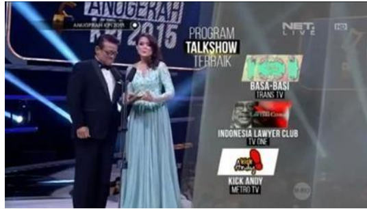
Gambar 3. Program Kick Andy sebagai program talkshow terbaik 2015

Sebelumnya, dalam acara Award KPI tahun 2015, program Kick Andy berhasil memenangkan award sebagai program talkshow terbaik. KPI menilai dari banyaknya aspek. Seperti, kedalaman konten, edukasi serta kontribusi sosial dari setiap program yang menjadi dasar pengukuran kualitas siaran. Dengan pencapaian ini, dapat disimpulkan bahwa tayangan Kick Andy sudah memenuhi standar yang ditetapkan oleh KPI (Patricia, 2024).